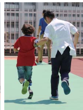
理学療法士と一緒に 義足体験

そこで、2017年より日常用義足を履いている方を対象に、同センターの屋上で競技用義足を使用した走行体験会「THE FIRST STEP」をスタート。走行体験会開催時は、診療所を併設しているため、理学療法士と義肢装具士のサポートに加え、医師や看護師も駆けつけられる環境にあり、安心して板バネ体験を楽しめるようにしている。「ほんの数カ月前に社会復帰し、歩いたり走ったりしている方たちを見ると、切断直後の入院患者は、少し先の自分の姿を思い描け、大きな励みになるようです。」(中野所長)