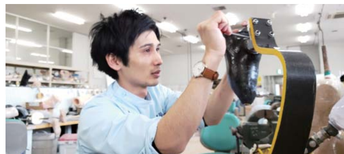
スポーツ用義足の製作

また、子ども向けにもっと手に入れやすいものにと、ナイロン樹脂製の板バネを開発し、2019年に意匠登録。この板バネは、大人の女性でも使用可能となっており、さらなる改良に取り組んでいる。