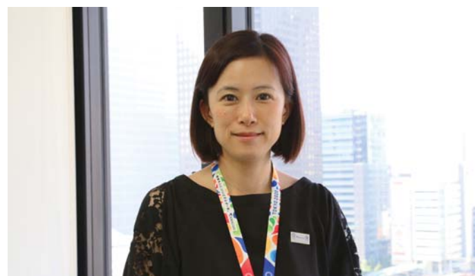
芳賀グループマネージャー

同社では、オリパラアンバサダー制度を実施しており、各職場のオリパラ活動のけん引役となっている。