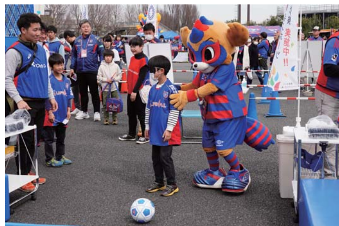
障がい者スポーツ体験会の様子

2013年に日本パラスポーツ協会のオフィシャルパートナーとなって、パラスポーツ運営ボランティアを社内募集するなど、ひと足早くパラスポーツに関わってきた同社。2015年に「東京2020オフィシャルパートナー」となっからは、パラスポーツと共生社会への理解を促す多彩な取組を行っている。