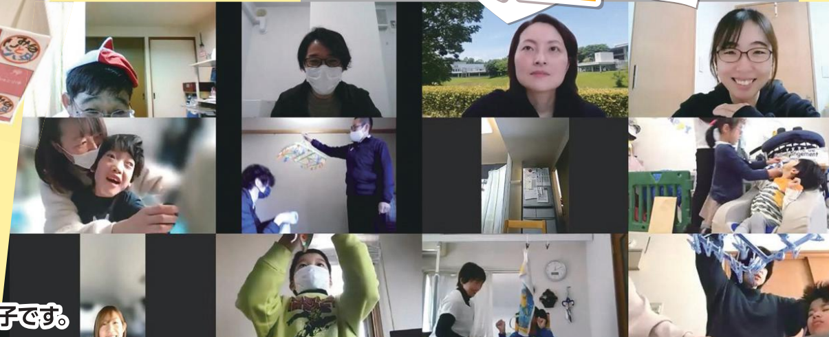
※写真は過去の教室の様子です。